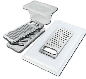
KIT RÂPES ET PLANCHE DE DECOUPE HDPE A159 A01 * uniquement en combinaison avec l'accessoire A644 A01