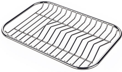
GRILLE PORTE-ASSIETTES INOX 25x35

A100 C03 * uniquement en combinaison avec l'accessoire A644 A01